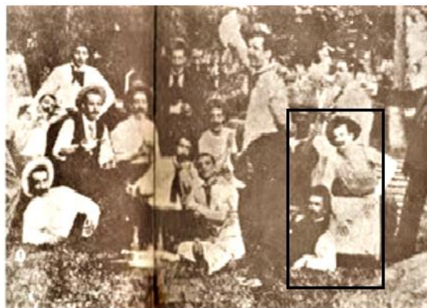
Figura 3: Boêmios tocando na praça (Fonte: Blog Folclore Musical Peruano, 2015).